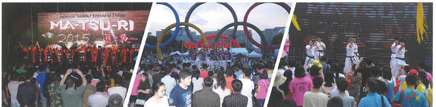
2015年6月、「2015日本商品大連地区巡回展」と同時開催した「MA-TSU-RI 2015 夏の夜」の様子